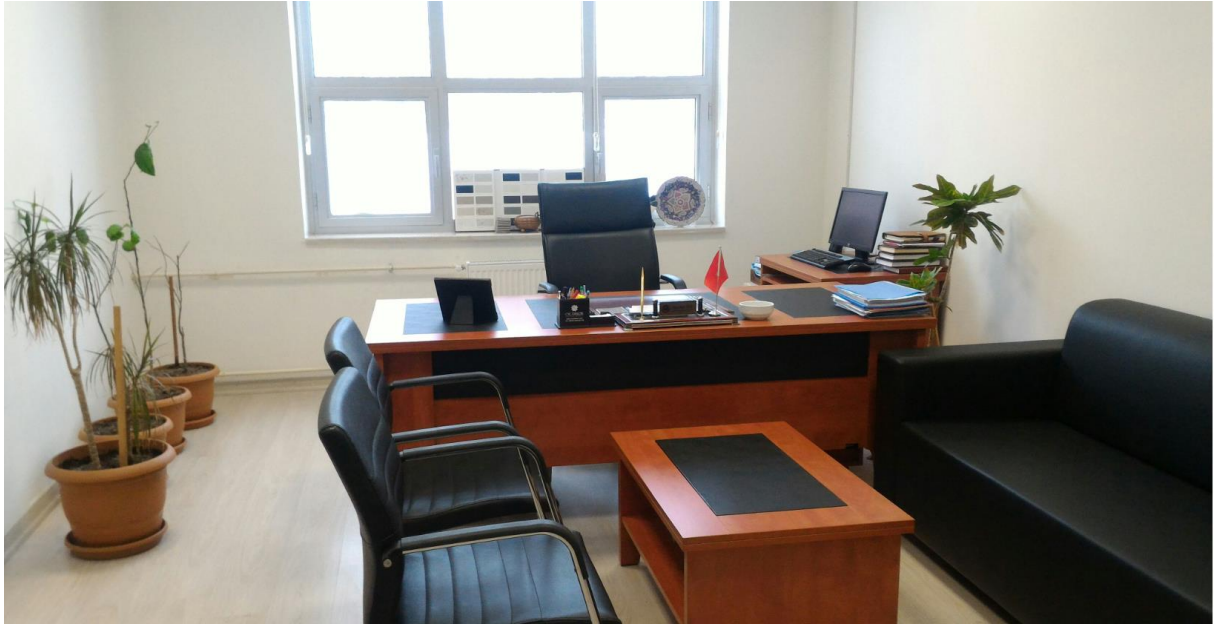
Şekil 1. Makam Odası

Döner sermaye İşletme Müdürlüğü, Üniversitemizin Bağlarbaşı yerleşkesi içerisinde bulunan Kongre Binası 3. katında yer alan bir büroda hizmet vermektedir.