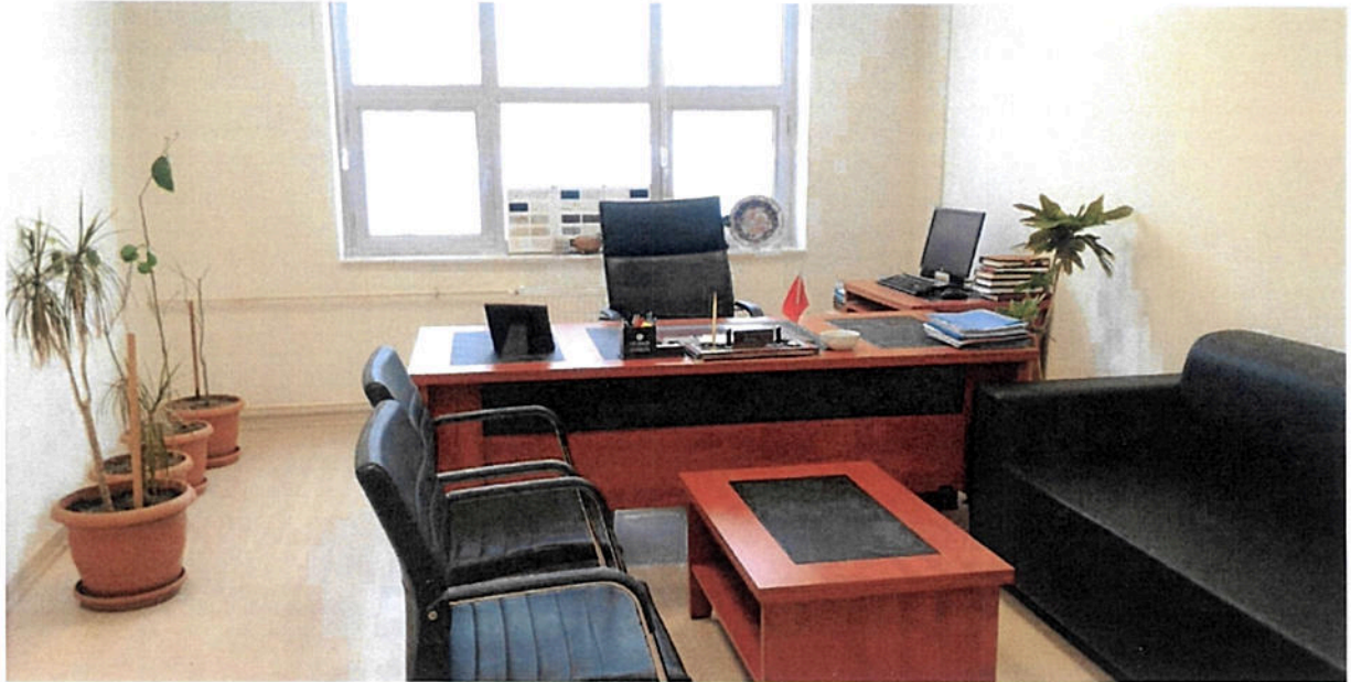
Şekil 1. Makam Odası

Döner sermaye İşletme Müdürlüğü, Üniversitemizin Bağlarbaşı yerleşkesi içerisinde bulunan Kongre Binası 3. katında yer alan bir büroda hizmet vermektedir.